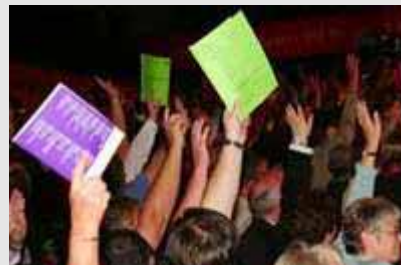
Einladungen zu Abteilungsversammlungen