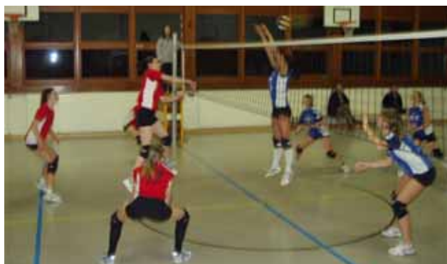
Juniorinnen A – Smash Pfeffingen