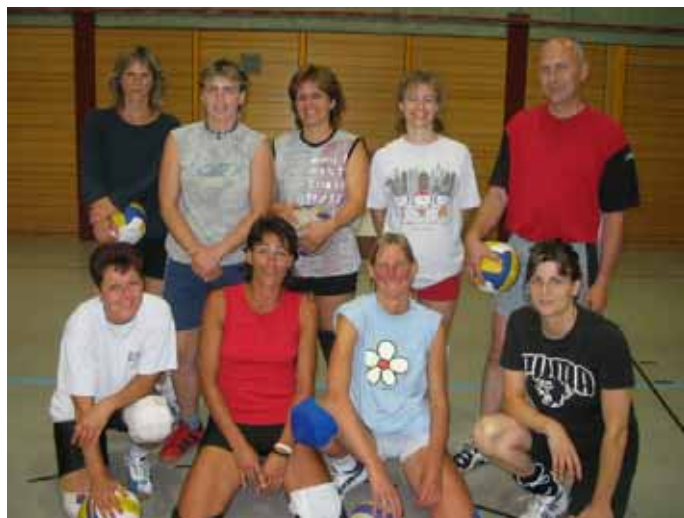
Damen 3 Team