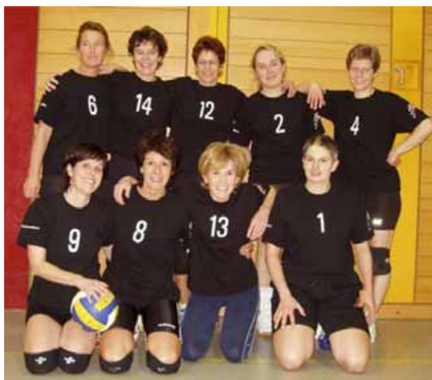
Damen Seniorinnen 2005/2006