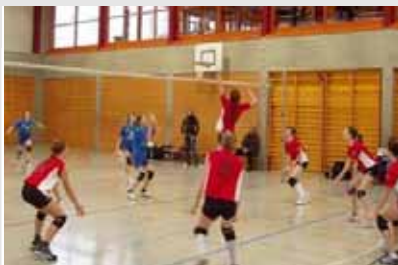
Saisonrückblick Volleyball p. 9