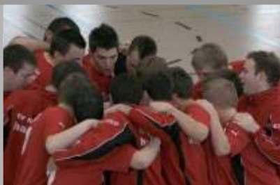
Berichte aus den Abteilungen