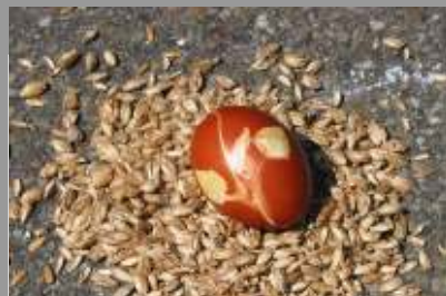
Eierleset, -dätsch, -buffet, -