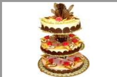
Kuchen fürs Jazz uf em Platz