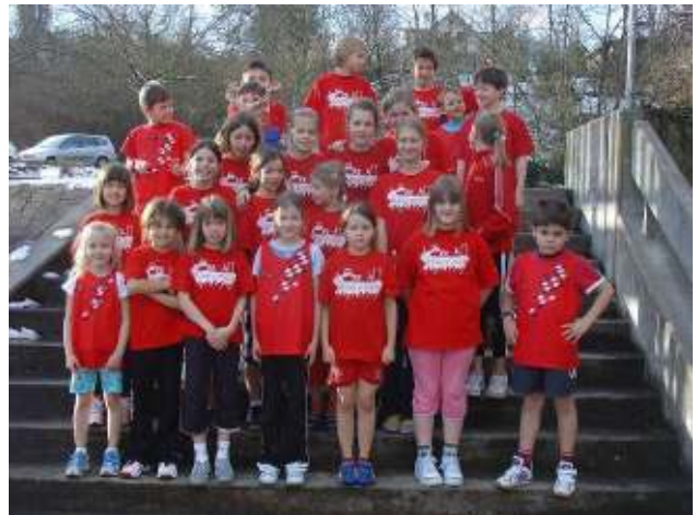
Beim traditionellen Hallenmehrkampf in Liestal war eine grosse Delegation mit MuttENZer Kindern am Start.