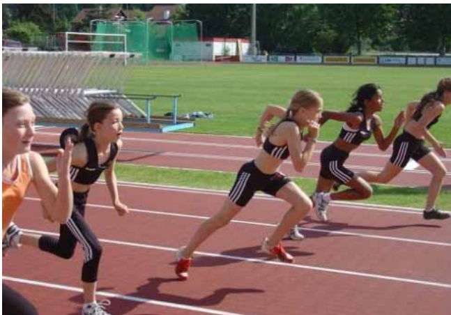
Dr Ziilgrade entgäge ...