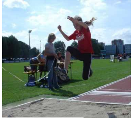
D Athlete hän alles gäh...