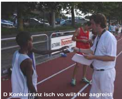
D Konkurrenz isch vo wiit här aagreist

Alli Bilder und Täxt vo de drei athletics-Syte stammed vo dr Nadine Schrutt.