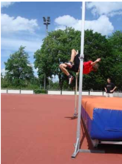
... und ihr Könn bewiise.