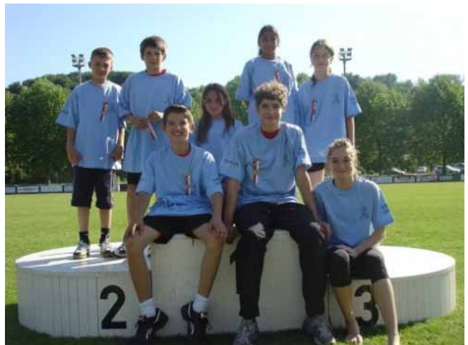
Di schnällschte Muttenger 2007