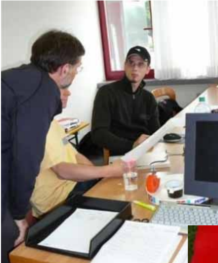
Au hinter de "Kulisse" wird flissig gschafft