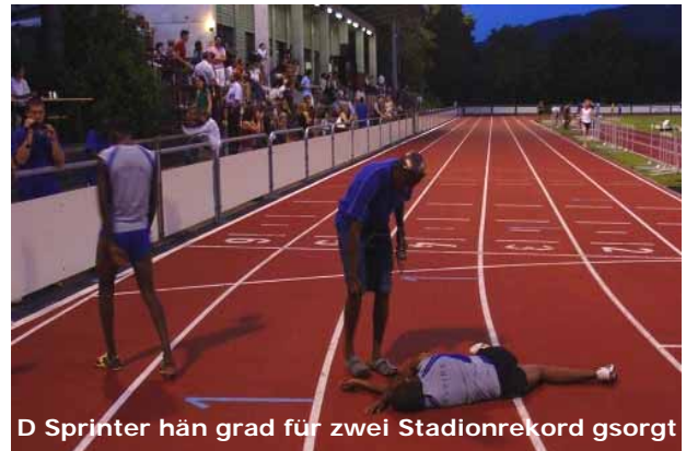
D Sprinter hän grad für zwei Stadionrekord gsorgt