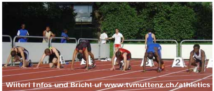
Wiitleri Infos und Bricht uf www.tvmuttENZ.ch/athletics

Alli Bilder und Täxt vo de drei athletics-Syte stammed vo dr Nadine Schrutt.