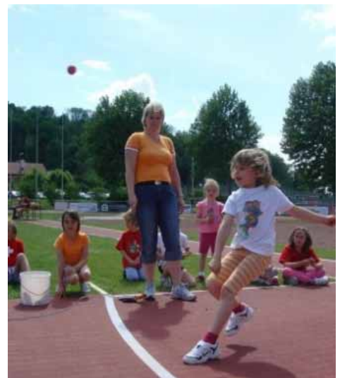
... und alli Chraft in Wurf lege.