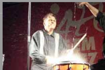
Jazz uf em Platz