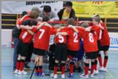
Sportliche Rück- und Ausblicke