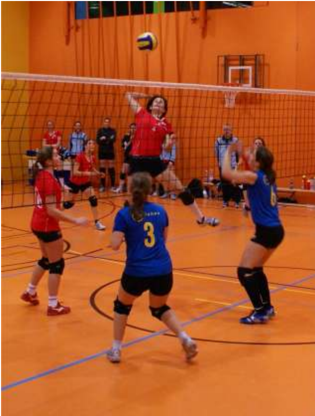
Damen 1 gegen KTV Riehen (3:2)

Über den Erwartungen schloss das Damen 1 Team als Aufsteiger die Vorrunde in der 2. Liga ab. Mit 5 Siegen in neun Spielen haben sie sich auf einem Mittelfeldplatz festgesetzt. Nun gilt es in der Rückrunde an die Leistungen der Vorrunde anzuknüpfen, um so den Klassenerhalt zu sichern.