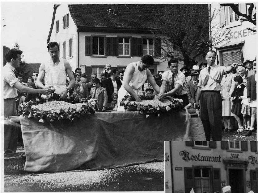
Eierleset im Oberdorf Anno dazumal...