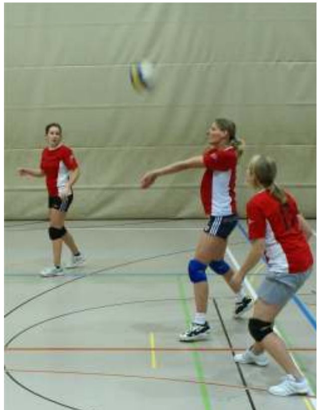
Damen 2 gegen Tecknau (3:1)

Die Juniorinnen U16 belegten in der Qualifikationsrunde den guten 3. Platz und können die Finalrunde in der besseren Gruppe bestreiten. Dort verloren sie ihr erstes Spiel in Therwil knapp mit 2:3.