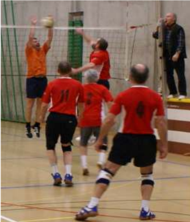
Senioren 2 gegen TV Itingen (0:3)

Ohne Steigerung wird es sehr schwierig werden den Klassenerhalt zu schaffen.