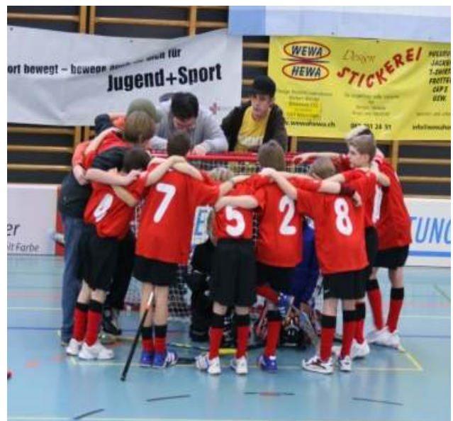
Junioren D – 22.12.07 in Kaiseraugst

Neben dem organisatorischen Roulette wird weiterhin Sport betrieben. Wir absolvieren gerade unsere erfolgreichste Saison. Alle Teams, von den Herren Aktive über die Junioren B bis zu den Junioren D spielen um die ersten 3 Plätze in der Tabelle. Wir sind vollends mit unserem Nachwuchs zufrieden. Für den Abteilungspräsidenten dürften die Junioren alle möglichst bald die Volljährigkeit erreichen, um der Aktivschicht ein Update zu verpassen.