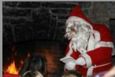
Jahresabschlüsse und Chlausehocks