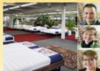
Bettenhaus Bella Luna