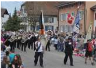
Mit Musik ...