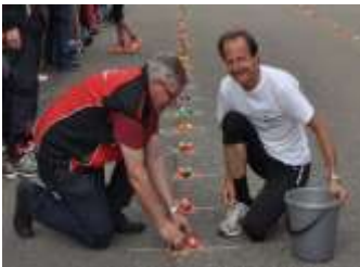
Vor dem Start ...