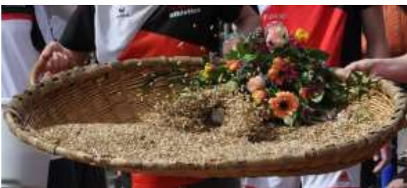
2 Volltreffer ... vom Werfer und Fotografen