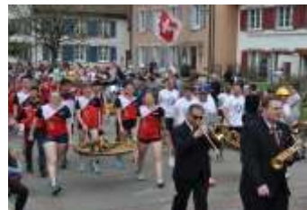
und den WettkämpferInnen