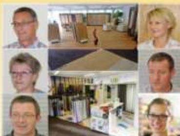
Mössinger Parkett Vorhänge